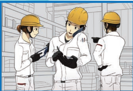
持続的に効率アップする!

服には、人を動かす力があります。 どのような制服や作業着を身にまとうかで、 頭も体も心の効率もアップできる可能性 を秘めています。まずは、ご自身の仕事内 容にピッタリの服を想像してみてください。