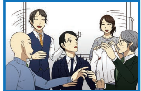
全員参加でウェアを考える