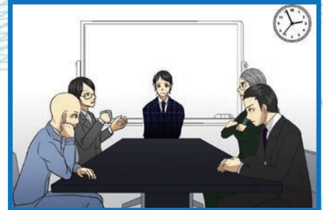
なんとなく社内がバラバラ