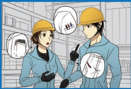
作業着の徹底的な工夫で