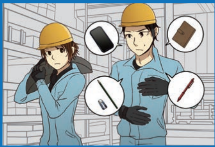
細かな日常動作のモヤモヤを