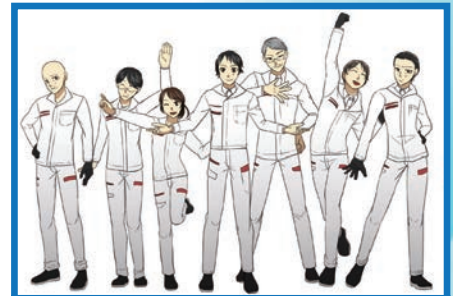
身も心も一体感が生まれる